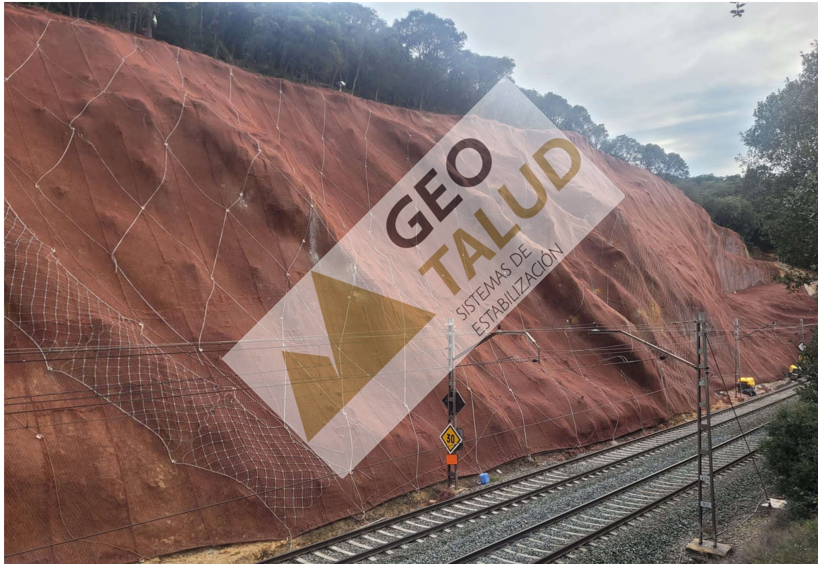
Panorámica del talud al finalizar los trabajos.