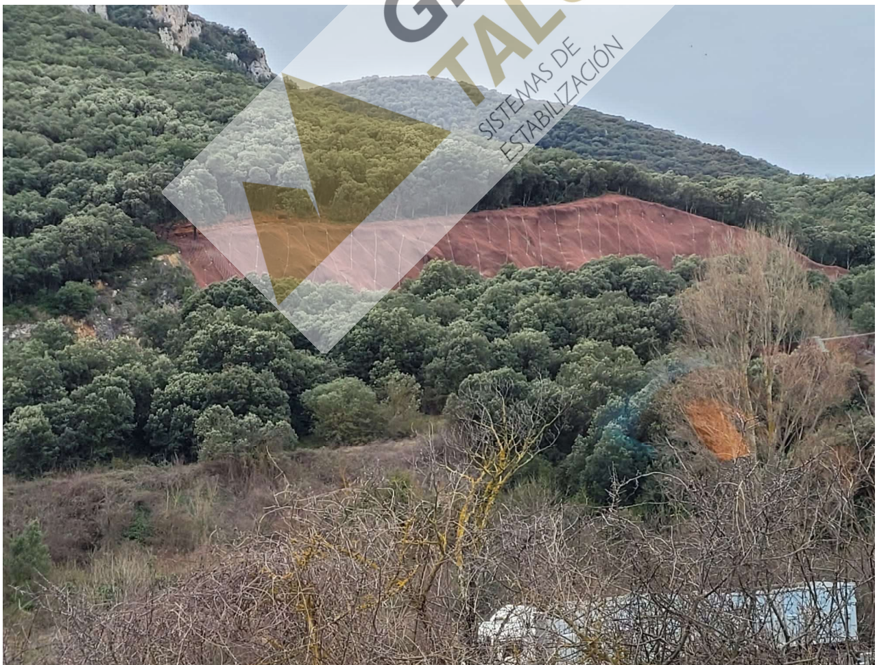
Panorámica de los taludes después de extendida los trabajos realizados.