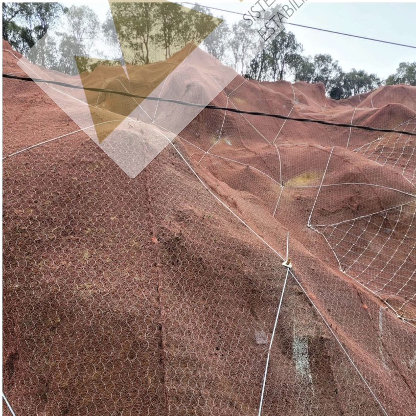
Detalle del correcto ceñido de la geomalla, cable de acero y red de cable al talud.