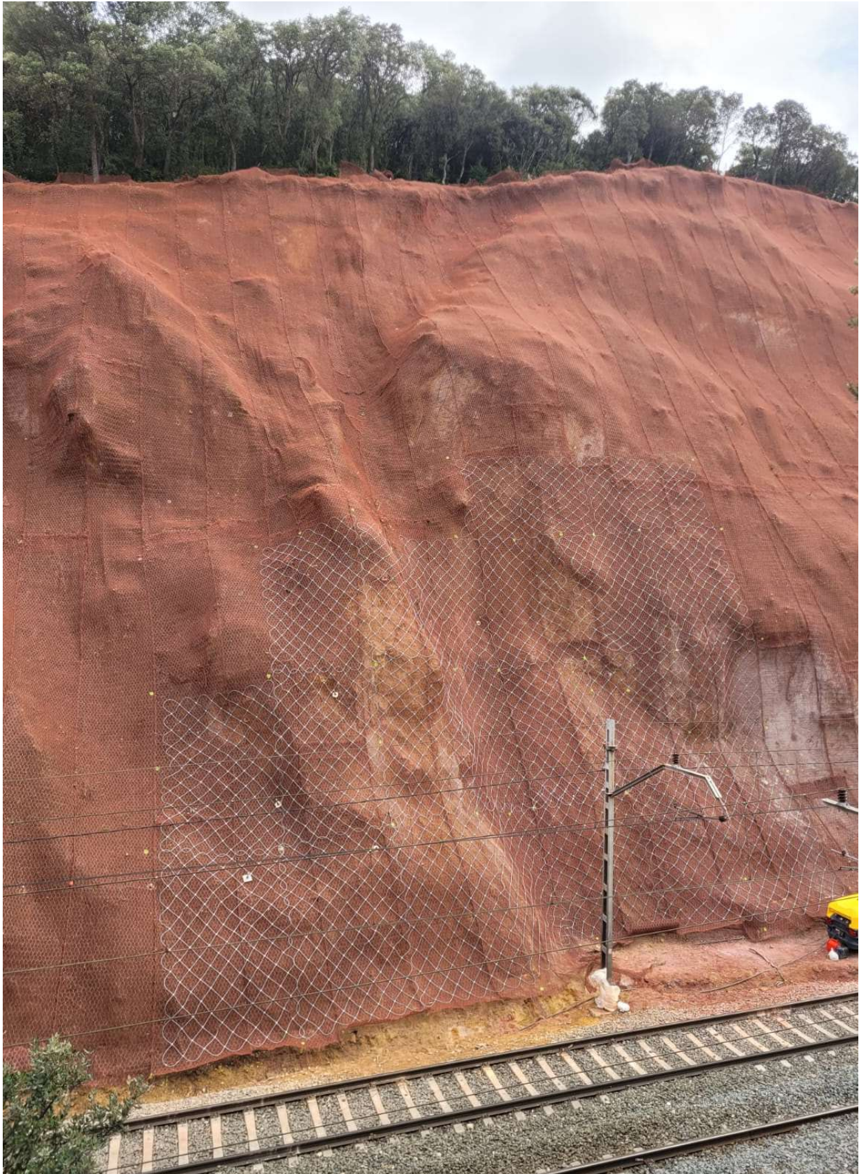
Vista del talud con la geomalla y red de cable instaladas.