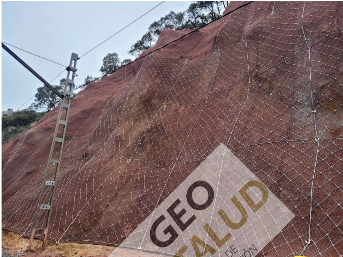
Vista desde el pie de la red de cable de acero instalada sobre la geomalla.