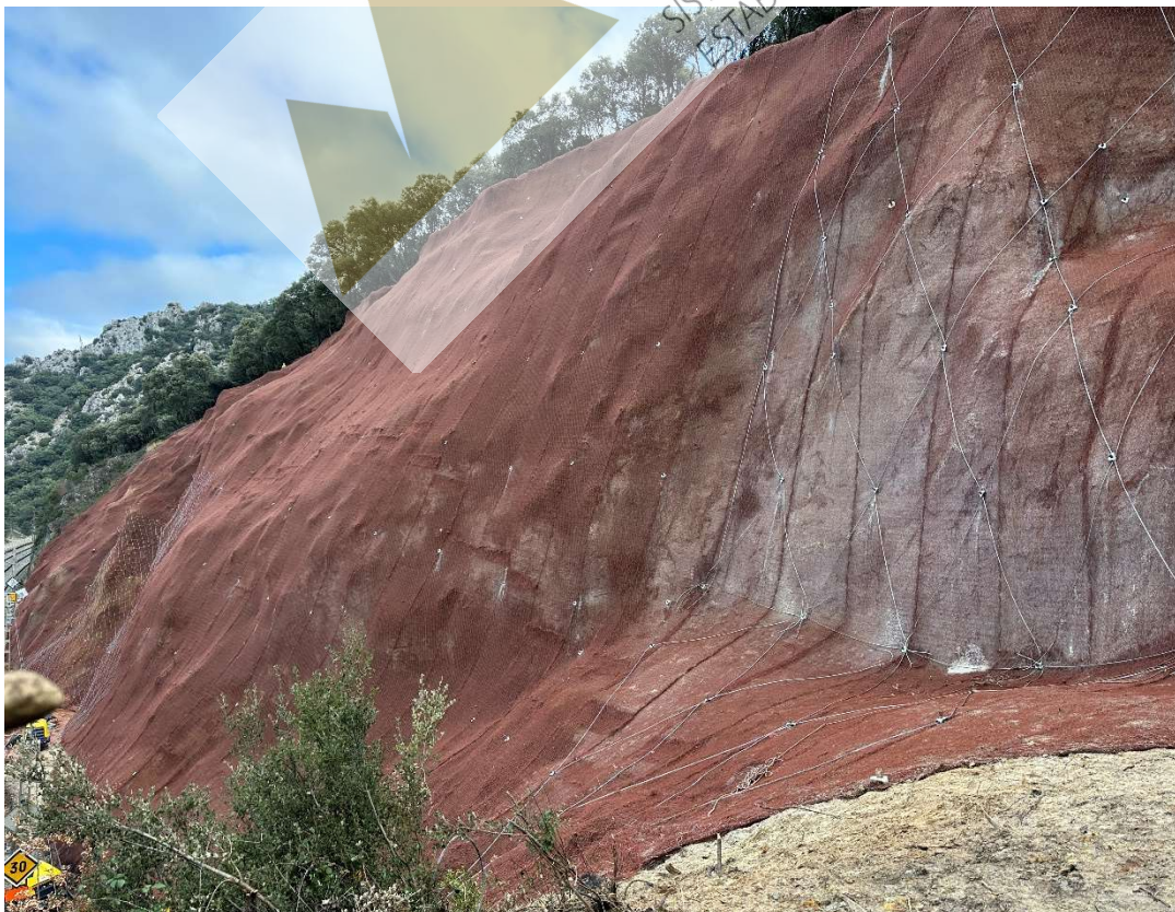
Vista general del talud con geomalla instalada y refuerzo con cable de acero y bulones.