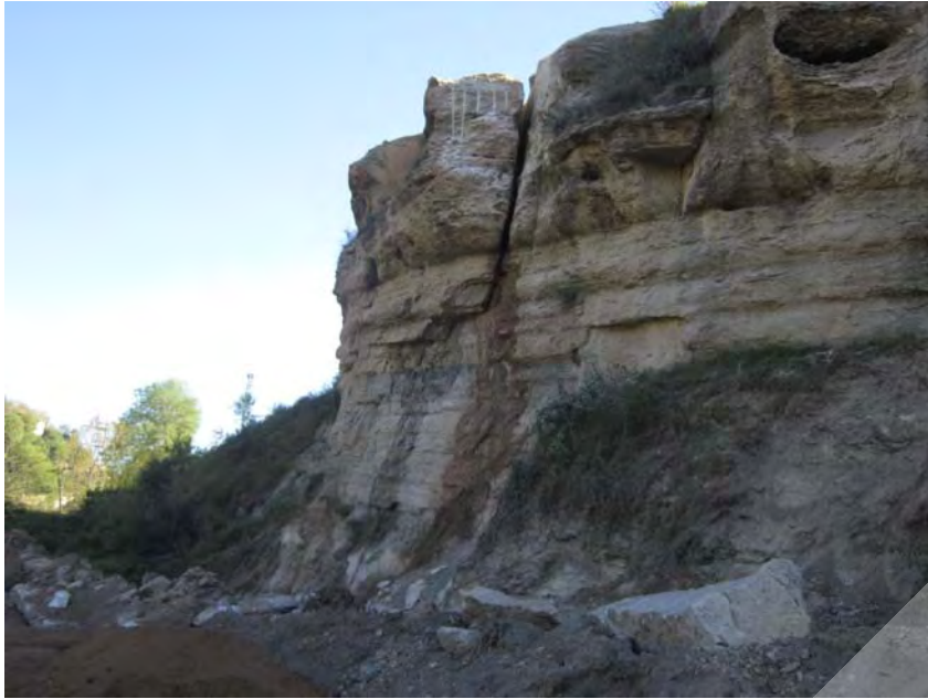
Trabajos de eliminación del bloque rocoso