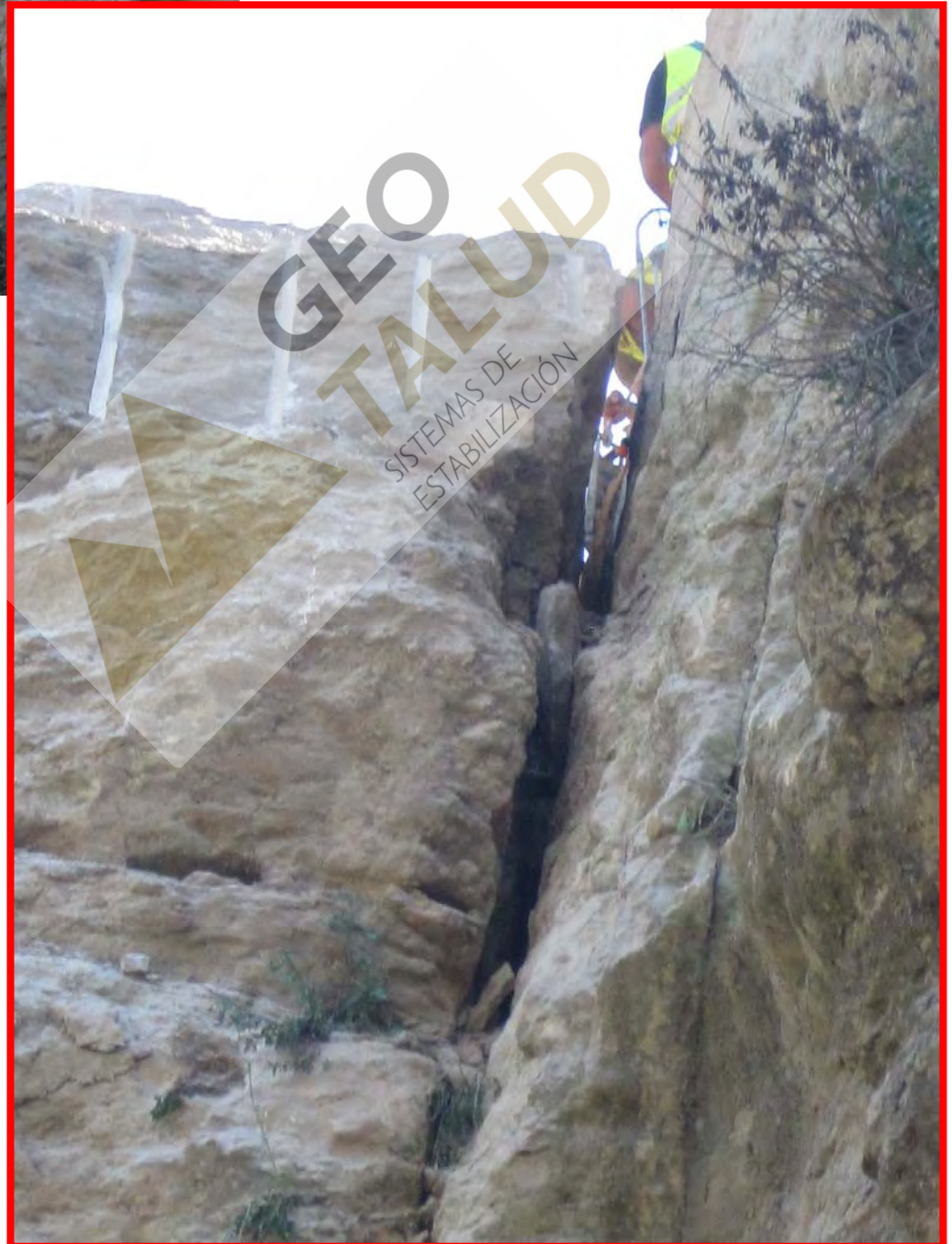
Detalle de la apertura de la grieta mediante la utilización de gatos hidráulicos