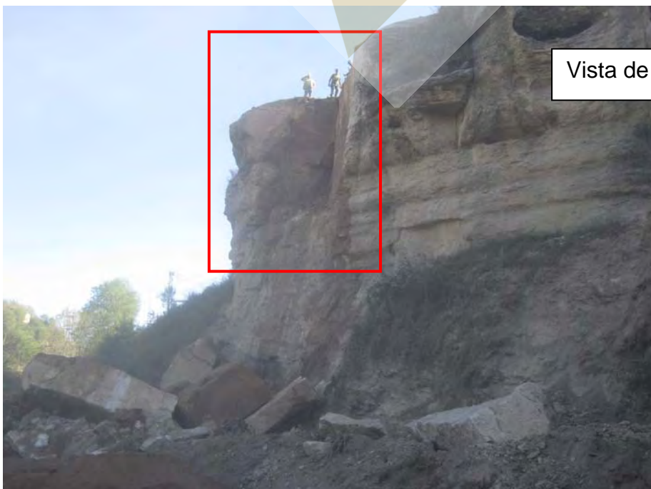
Vista de la zona una vez eliminado el bloque

Secuencia de la eliminación del bloque mediante la utilización del quebrantador “darda” y gatos hidráulicos