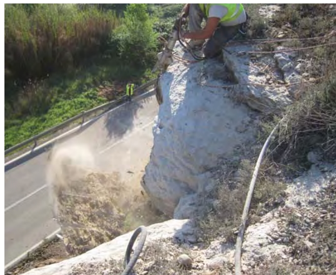
Secuencia de fracturación del bloque y eliminación de un voladizo