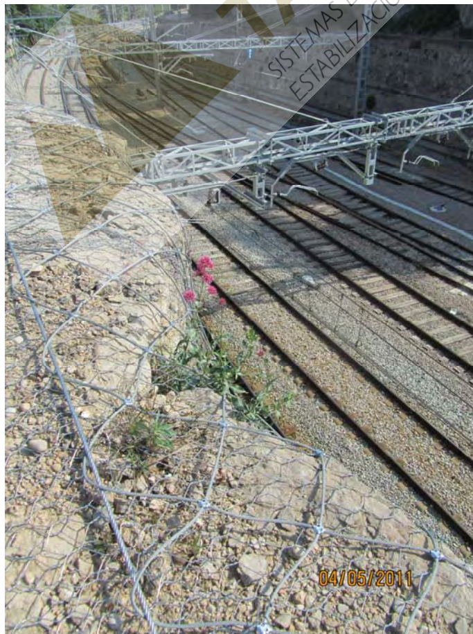
Detalles de la malla de triple torsión reforzada con red de cable de acero colocada en el talud del lado vía.