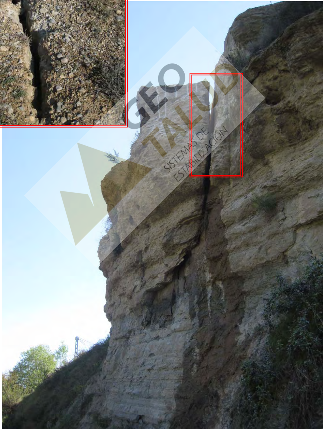
Detalle de la grieta que presentaba un bloque, previo a los trabajos de eliminación del mismo