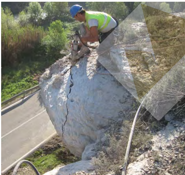
Eliminación del bloque por la zona fracturada mediante la utilización de cuña hidráulica.