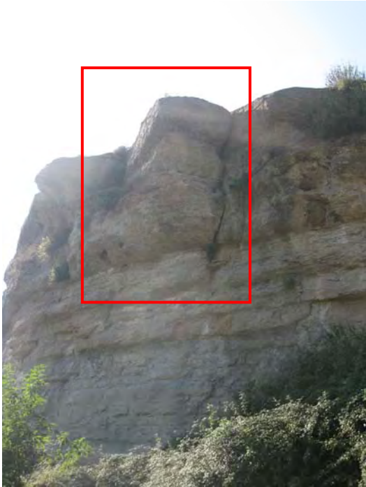
Vista del bloque previa al inicio de los trabajos de eliminación