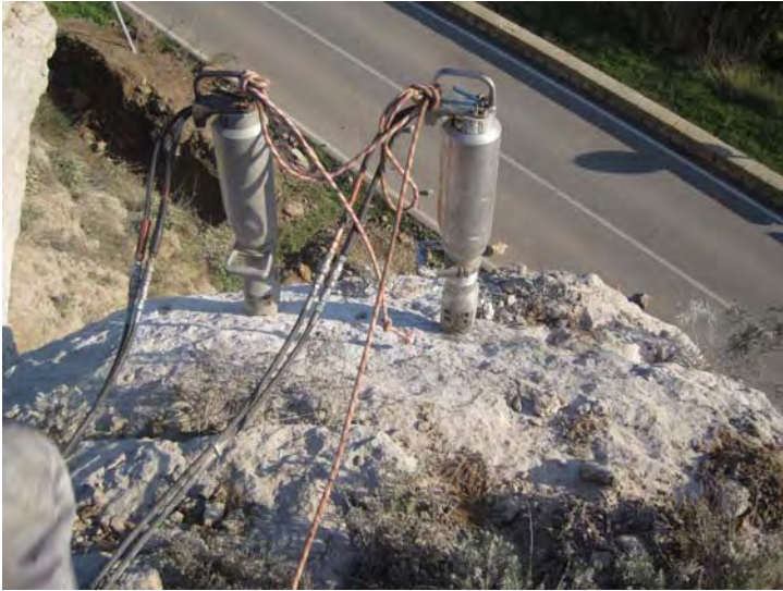
Fracturación de la roca mediante quebrantador hidráulico tipo “darda”