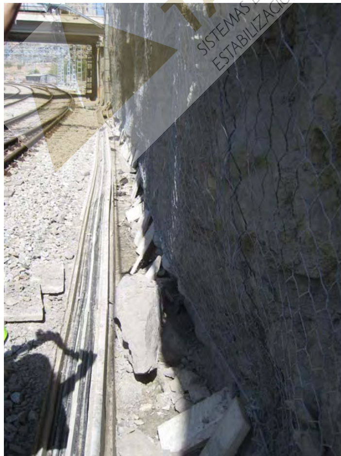
Detalles de la malla de triple torsión colocada en el talud del lado vía.