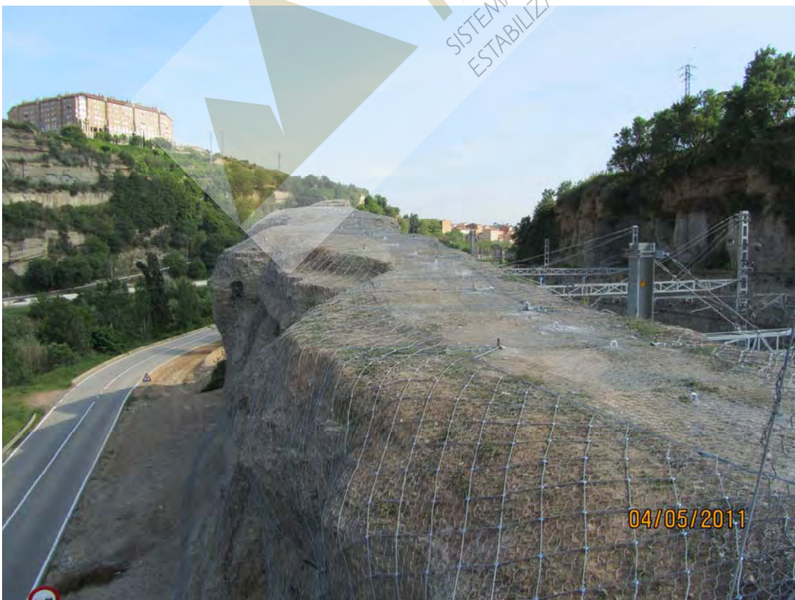
Vista de la cabecera del talud previa y posterior a la colocación de la malla de triple torsión y red de cable de acero.