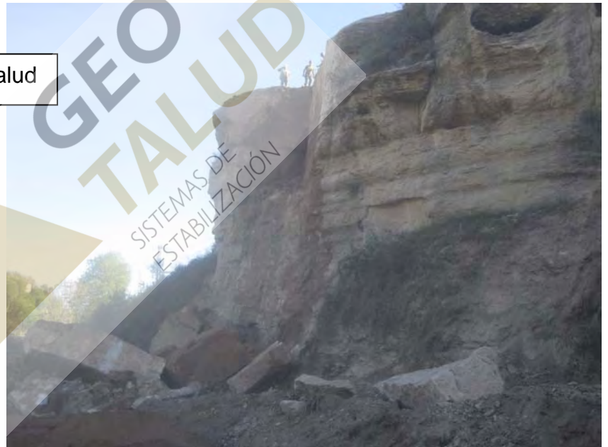
Bloque rocoso eliminado del frente del talud