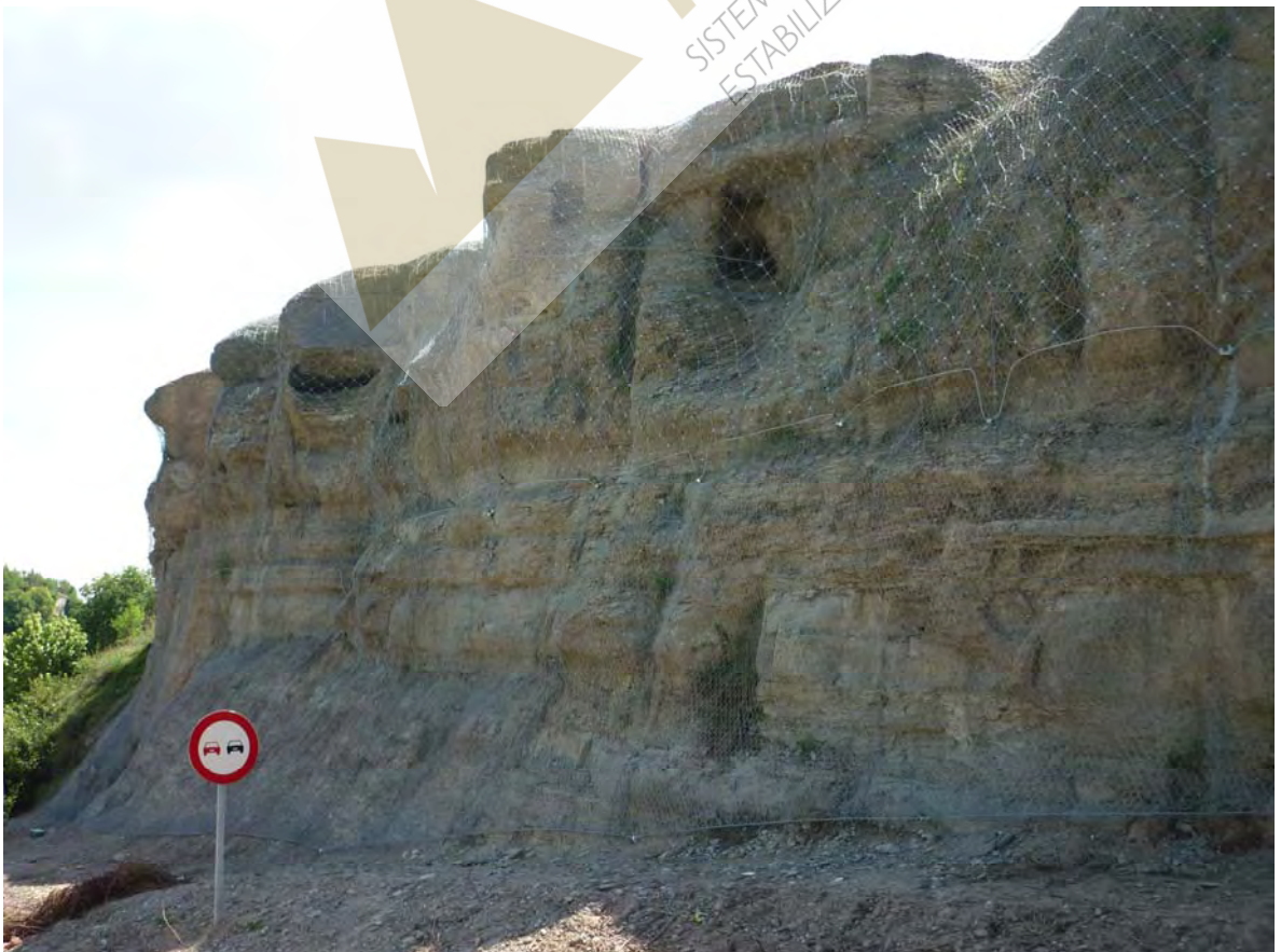
Vista general del talud en el lado carretera, previa y posterior a la colocación de la malla de triple torsión y red de cable de acero