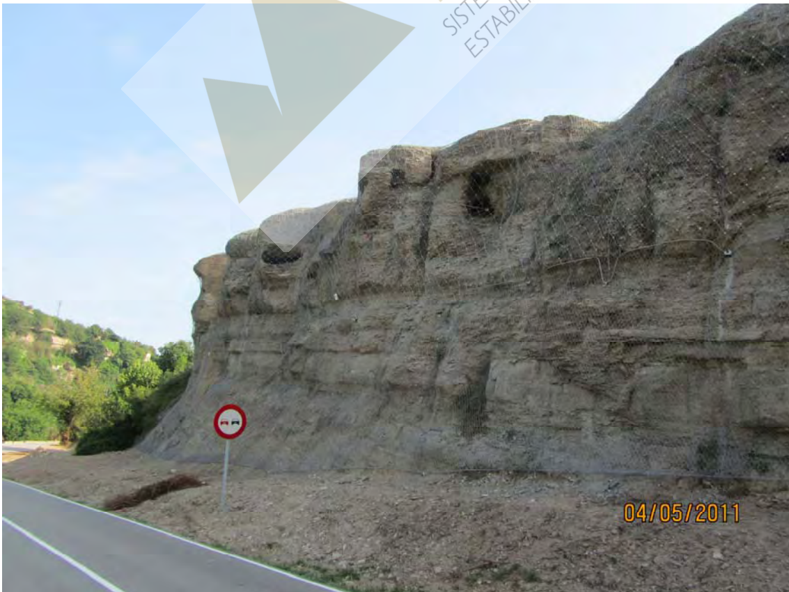
Vista general del talud en el lado carretera, previa y posterior a la colocación de la malla de triple torsión y red de cable de acero.