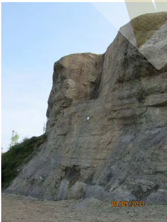
Zona protegida mediante malla de triple torsión y red de cable de acero tras la eliminación del bloque

Secuencia de actuaciones en la parte izquierda y más problemática del talud debido a la existencia de grietas en cabecera que individualizaban un bloque de gran tamaño