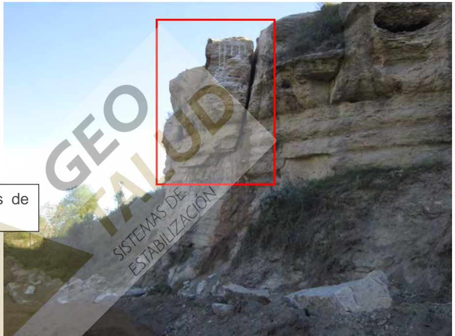
Vista del bloque durante los trabajos de “cuña” para la eliminación del mismo