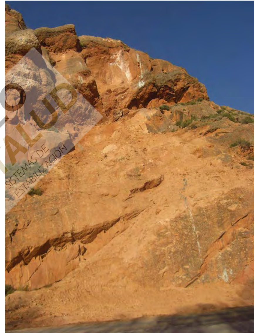
Detalle del saneo manual de bloques realizado