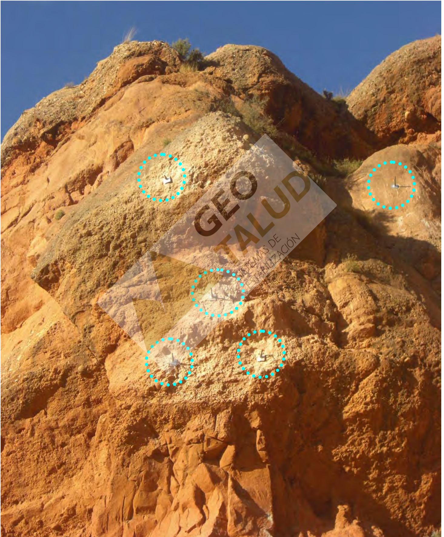
Detalle bloques bulonados (GEWI Ø 32 mm L= 6 m.)