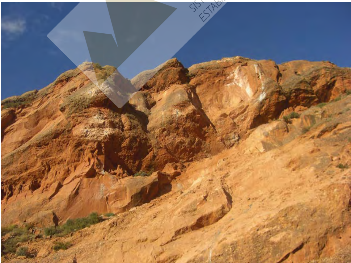
Vista del talud anterior y posterior a los trabajos de saneo manual y bulonado de bloques (GEWI Ø32 mm L= 6 m.)