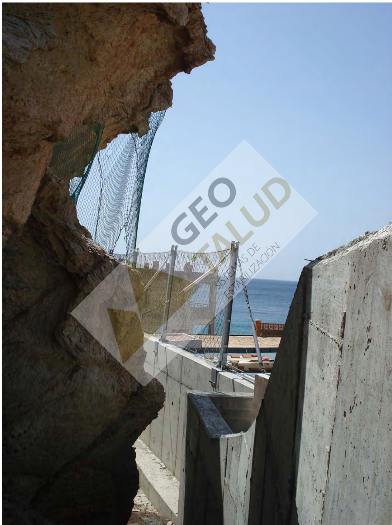
Vista parcial de la barrera con capacidad de absorción de energía de 250 KJ y H = 3m, colocada sobre muro de hormigón